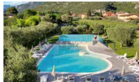
Tre dimensioni per una scelta di qualità.

IL WELLNESS dispone di vasca idromassaggio, sauna, bagno turco, doccia emozionale oltre a una palestra attrezzata Technogym. Inoltre la piscina coperta è dotata di idromassaggio.